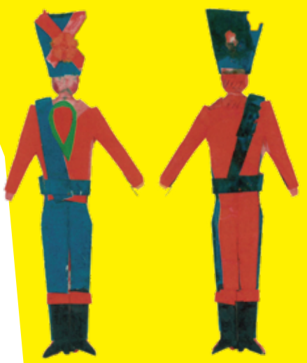
chokichaki hasamini yumewa nosete