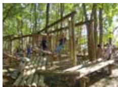
森林中的体育运动

小型高尔夫球，变形自行车，小火车以及淘气鬼平衡球小岛也很受欢迎。丰富多彩的食品店的美味也请各位品尝一下。