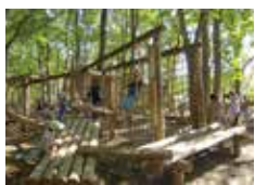
森林運動攀爬遊具

小型高爾夫，改良式腳踏車，小火車，以及淘氣平衡球極受歡迎，此外也請嘗試享受，各種豐富多樣的美味食品。