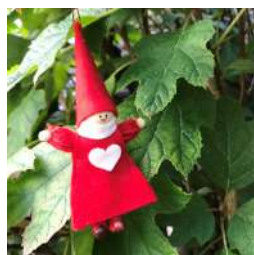
ワークショップ ニッセ作り