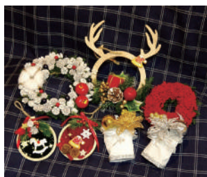
ワークショップ オリジナルリース作り