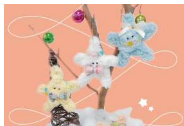
ワークショップ お星さまオーナメント作り